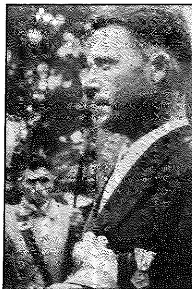
Martial BIZIEN, décoré de la Légion d'Honneur.

Début 1941, c'est une époque où les Allemands n'ont pas encore commis trop d'actes déshonorants. Un procès dans les formes, a lieu au mois de mai au tribunal militaire de la rue Saint-Dominique à Paris avec de vrais juges. Fait unique, le tribunal reconnaît aux accusés le grand mérite d'avoir agi par amour de la patrie. Néanmoins d'Estienne d'Orves est condamné à mort après avoir demandé la grâce de ses compagnons.